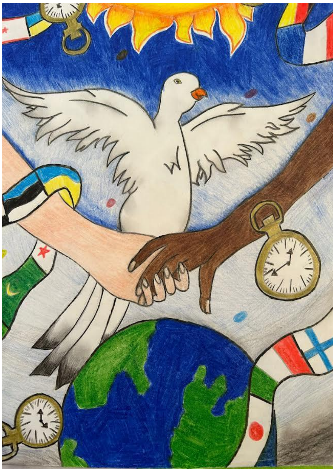
Caronna Miriam I. C. "Tisia D'Imera" Termini Imerese - III C III Classificata