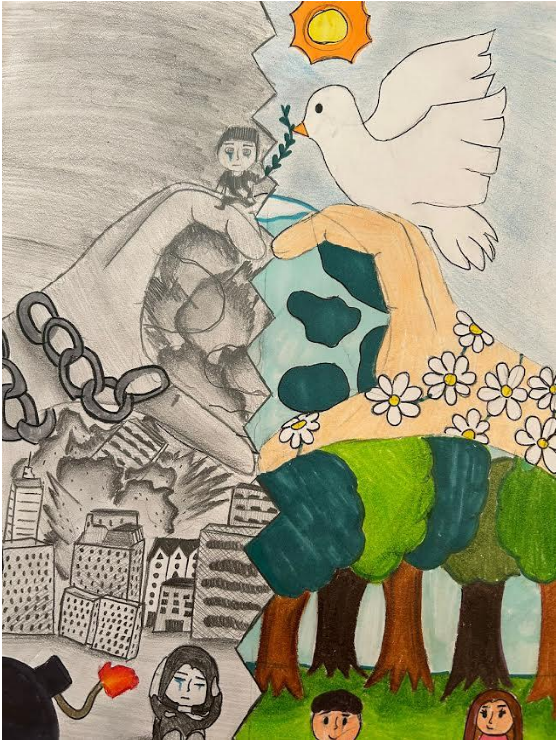
Virga Ludovica I. C. "L. Pirandello" Cerda - II C I Classificata